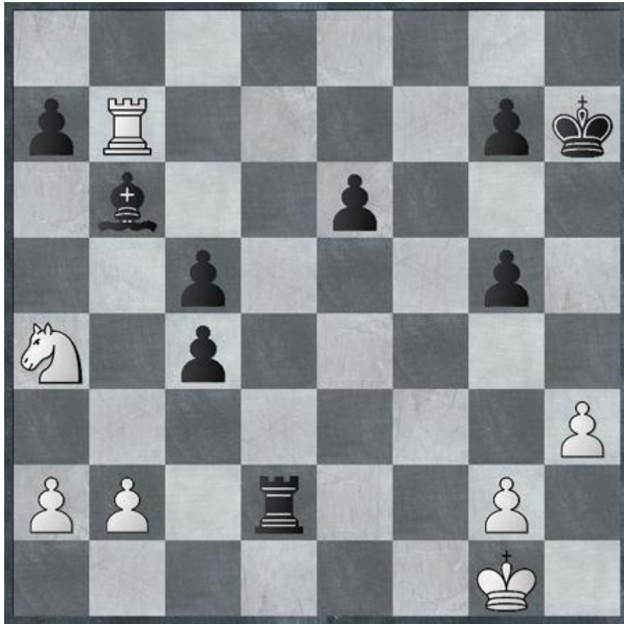
Angeblich aus einer Partie Ortueta-Sanz, Brasilien 1934. Schwarz am Zug

Die Kombination, die der Schwarze in dieser Partie fand, ist absolut faszinierend, und es fällt mir schwer zu glauben, dass sie wirklich einer gespielten Partie entstammt. Ist aber auch egal. Schwarz ist jedenfalls am Zug und findet eine wunderschöne Möglichkeit, das Maximum aus nur 2 einzelnen Bauern herauszuholen, so dass diese stärker sind als Turm und Springer (!) des Gegners: